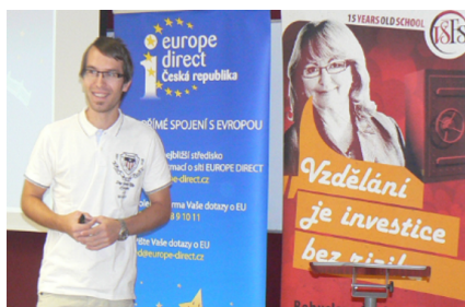
Obr. 1: Foto z pořádaných kurzů, fotky zaměstnanců KJ FSS VŠFS v Mostě a Europe Direct Most

Kurz EuroCool je jedním z nejstarších a nejvíce navštěvovaných kurzů věnující se vybraným konverzačním tématům v evropském kontextu. Témata pro daný rok