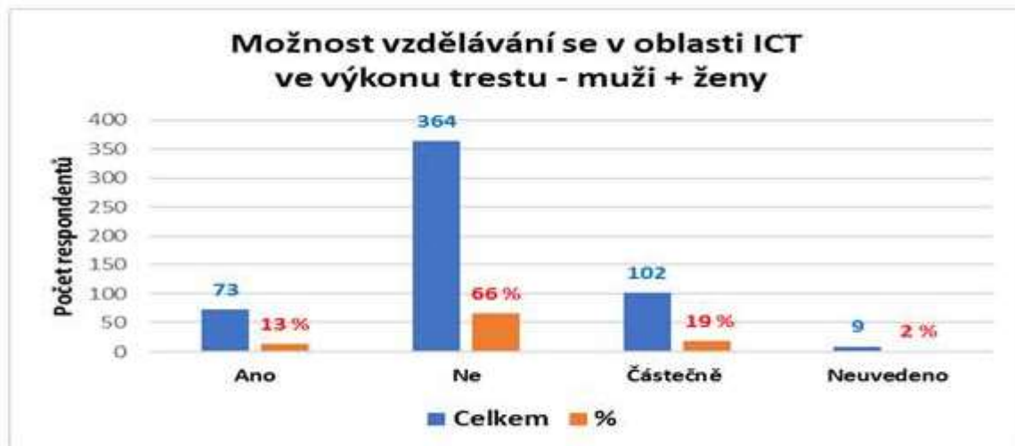
Graf č. 3: Možnost vzdělávání se v oblasti ICT ve výkonu trestu – muži + ženy

Zdroj: Vlastní konstrukce na základě kvantitativního průzkumu.