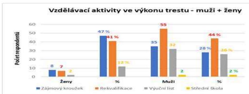
Graf č. 2: Vzdělávací aktivity ve výkonu trestu odnětí svobody – gender rozložení