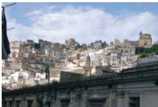
Město Ragusa leží na jižním výběžku pahorku Hybla v oblasti říčních údolí.

Blížil se konec dovolené a už to vypadalo, že nebudu moci odletět. Ztracená na Sicílii?! Alitalia stávkovala, můj let byl zrušen. Kmotr se usmál pod vousy a vytočil neznámé číslo: Sí, sí, va bene, perfetto . První letadlo, které startovalo z Katánie do Říma, má pro mne volné místo v „businessu“.