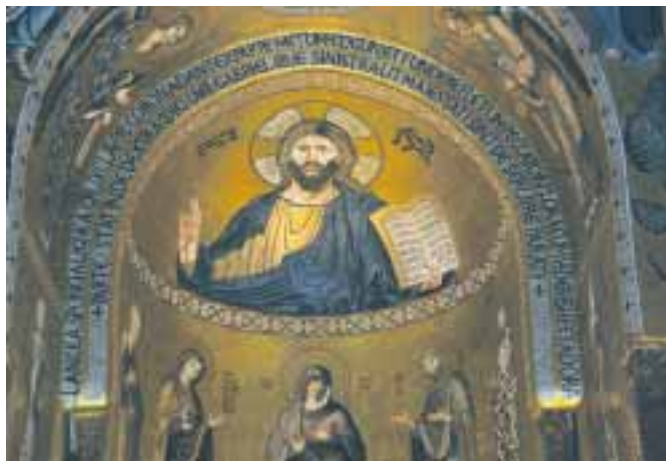
Palatinská kapele v Palermu. Je vyzdobena typickou mozaikou neobyčejné krásy a velmi jemným dřevěným stropem.

Pár dní jsme věnovali prohlídce Palerma a jeho okolí. S odstupem času zůstává dojem poklidného jakoby provinčního města s nádhernou architekturou a milými lidmi, kteří si stěžují jen na euro a zdražování. Navštívili jsme všechny významné památky včetně Monreale s nádherným výhledem na záliv a Palermo. Pak jsme se spolu vydali autem křížem krážem po Sicílii. Nejprve podél pobřeží na západ, u Castellammare jsme změnilí směr na jih. Následuje řada historických měst Segesta, Selinunte, Agrigento, Caltagirone, Ragusa, Modica i „konec světa“ Marina di Modica, Noto, Syrakusy, nádherná Taormina a nakonec Katánie. Zařídil