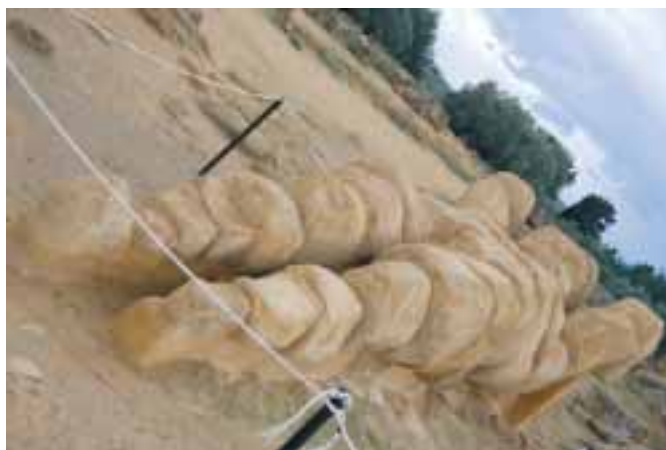
V Agrigentu jsem obdivovala sochu jednoho z obrovských Telamónů (Atlantů), které zdobily Chrám Dia Olympského.

Stalo se to při výletu do romantického městečka Taormina. Leží na vrcholku skály nad mořem. Autem se tam nedostanete, všude je hrozně málo místa, parkuje se pod kopcem. Počasí bylo zpočátku nádherné. Prošli jsme celé město včetně římského divadla. Černočerné mraky od pevniny nevěstily nic dobrého. Sotva se za námi zavřely dveře auta, začalo pršet. Ne, to nebyl normální déšť, ale totální průtrž mračen. Bylo třeba dostat se co nejdříve na dálnici, která vedla někde vysoko nad námi. Navrhovala jsem odbočit vlevo, kmotr však zahnul vpravo. Jeli jsme krokem, silnice lemovala moře a stěrače tu spoustu vody nepobraly. Zastavit by znamenalo úplný konec. Voda netekla jen shora, ale i zdola. Kanály vyskakovaly jako na povel a z nich prýštily vodotrysky. Dnes jsem přesvědčená, že to celé byla „zkouška“. Pozoroval mě koutkem oka. Nehnula jsem ani brvou. Měl stále moji stoprocentní důvěru. Jeden blesk stíhal druhý. Auto zvládal jako James Bond. Těch 7 km jsme projeli jako ve snu. Příští odbočku na dálnici jsme neminuli. Jindy při výletu do vnitrozemí zase teploty klesly až k nule. V autě i v hotelích však bylo příjemně teplo a panovala přátelská nálada.