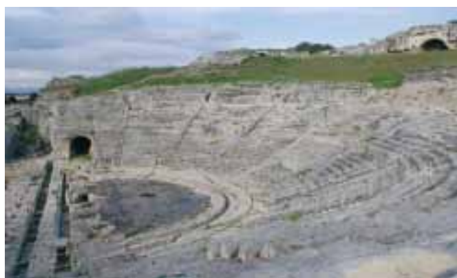
V Syrakusách najdete i řecké divadlo z 5. století př. n. l.