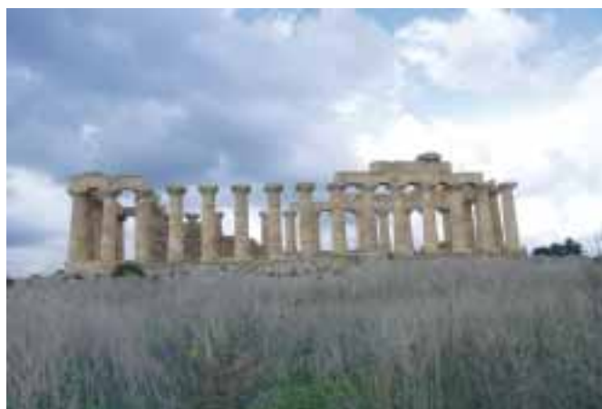
Chrámy bohyně Héry pocházející ze začátku 5. století př. n. l. v Selinunte.

všechno perfektně. Během těch dlouhých hodin na cestě byl vždy upraven a s dobrou náladou. Na většinou romantických večerích jsme probrali všechno možné – politiku, ekonomiku, finance, historii, kulturu i osobní záležitosti. Jen jedno neuměl zařídit ani „kmotr“ – lepší počasí. Až na