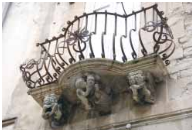
V Raguse jsem neodolala a vyfotila jeden z balkonů budovy v historickém centru. Později jsem zjistila, že podobná fotografie je pro město typická.