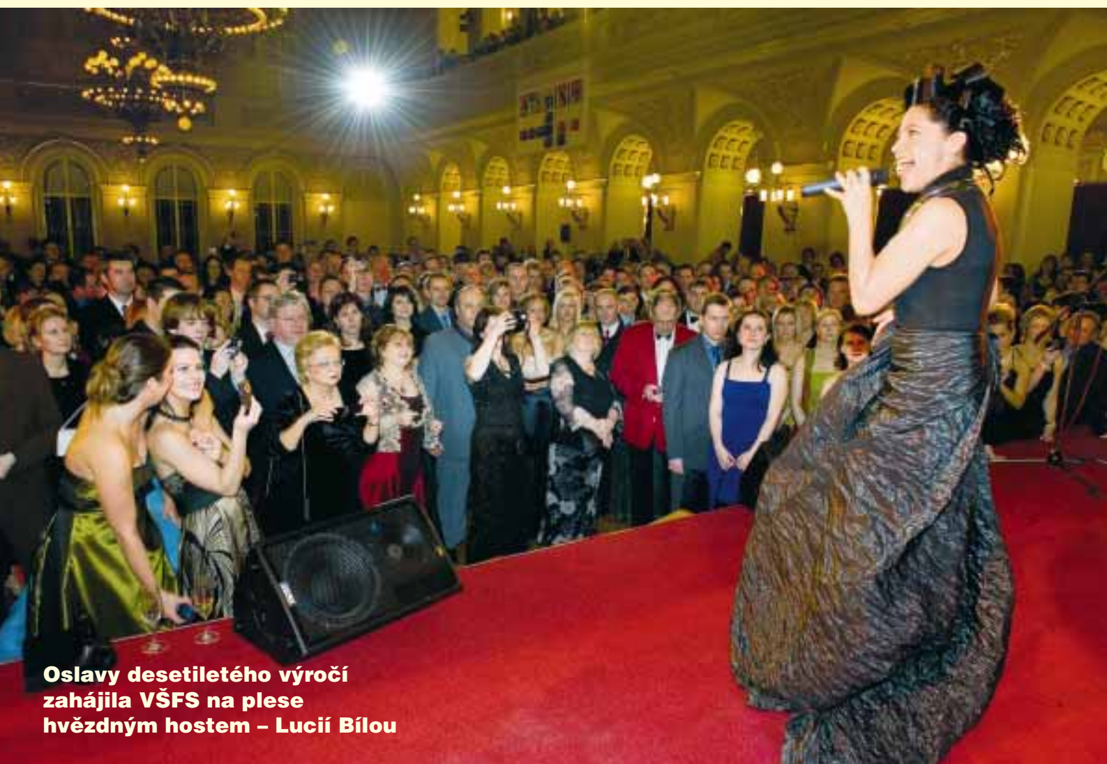
Oslavy desetiletého výročí zahájila VŠFS na plese hvězdným hostem – Lucií Bílou