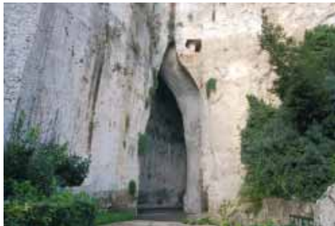
Umělá jeskyně „Dionýsovo ucho“ přitáhne v Syrakusách nejméně jednoho turistu.

Loučení trvalo krátce. Něco mi pošeptal a dodal: Ciao, cara! Směji se: Ciao caro!