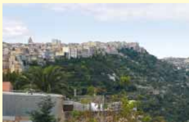
Město Ragusa na Sicílii