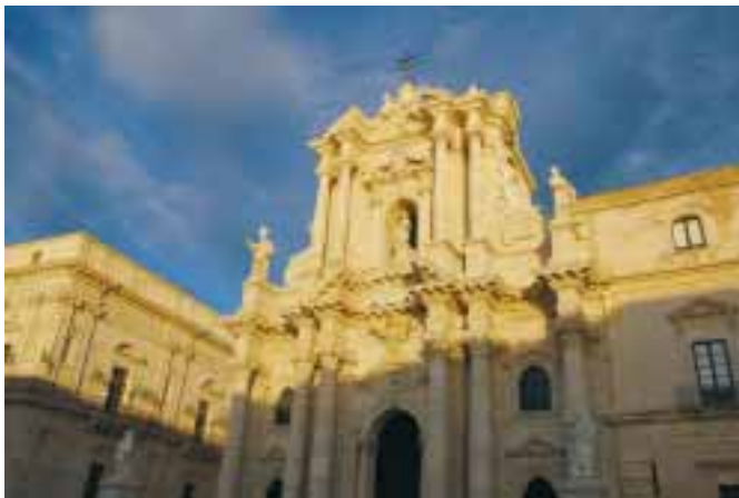
Barokní katedrála městěčku Noto dokončená kolem roku 1770.