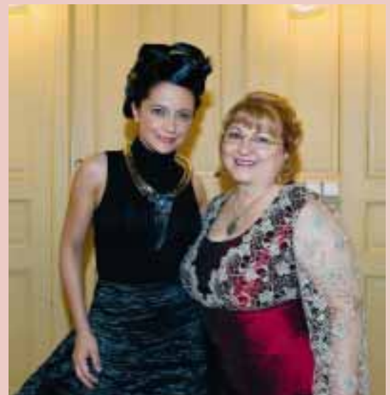
Rektorka školy s hvězdou Lucií Bílou, fotografie z jejího vystoupení viz titulní strana časopisu.