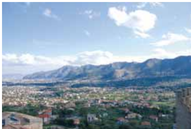
Pohled na Palermo z nedalekého městečka Monreale je skutečným požitkem.