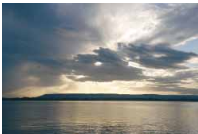
Pobřeží Villa Romana.