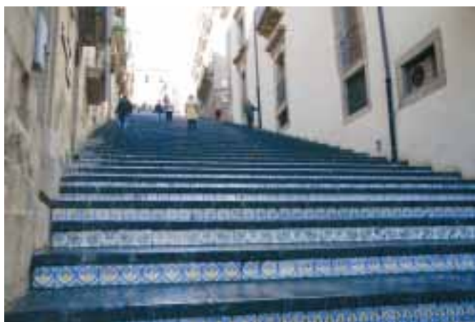
Caltagirone se pyšní keramickými schody La Scala vedoucími ke kostelu Santa Maria del Monte. Každý schod má jinou dekoraci.