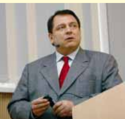
Jiří Paroubek přednášel studentům