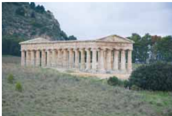
Velkolepý dórský chrám v Segestě byl postaven ve druhé polovině 5. století př. n. l.