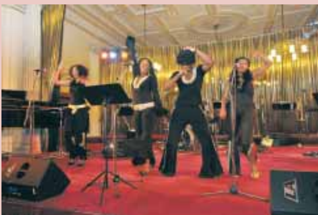
Doslova do varu dostalo přihlížející vystoupení Boney M Revival, jedno z nejlepších revivalových vystoupení na plesech VŠFS a BA vůbec.