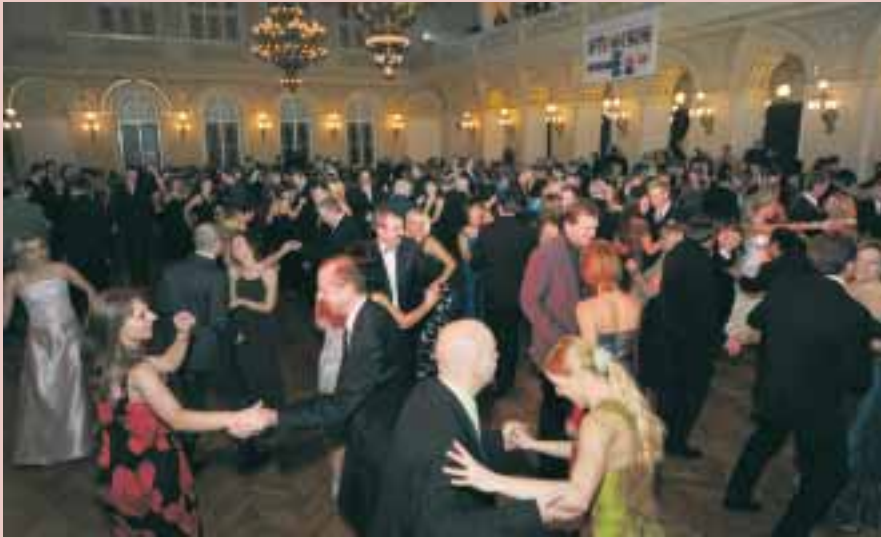
Taneční parket byl celý večer zaplněn, radost z tance z přítomných přímo vyzařovala.