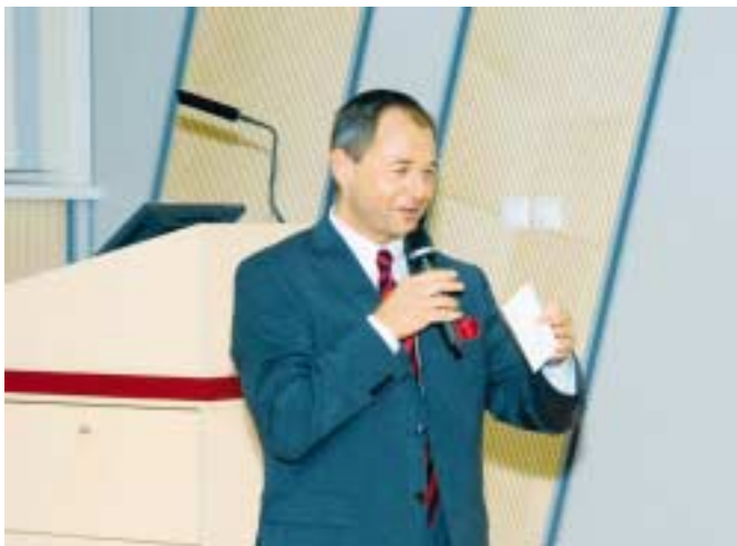
Pozdrav Jana Mühlfeita nejenom absolventům

Absolventi dávají v pravidelných anketách najevo, že je stále zajímavá, jakými cestami jejich alma mater kráčí, a tak byli další minuty programu věnovány právě rozvoji školy a konkrétním nabídkám pro absolventy. Aprílový šotek trošku zkomplikoval vystoupení rektorky, ale ta se nenechala vyvést z míry a po dobu technického výpadku své prezentace bravurně prezentovala všechny podstatné informace o škole „spatrá“. Apríl se na chvíli stáhl, technika se umoudřila a rektorka svoji prezentaci zakončila za potlesku posluchačů. Zbytek prezentací již probíhal v klidnějších vodách.