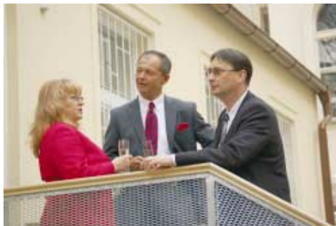
Povídalo ... vzácní hostě v rozhovoru s rektorkou

se bouřlivých ovací, které se opakovaly při jímavé scéně děkování a předávání květin. Možná, že část dojetí byla způsobena i vědomím, že od lákavého rautu dělí všechny právě a jen květinový ceremoniál uspořádaný pro tvůrce filmu. Všechno má svůj konec, a tak skončil i program a nastala neočekávanější část odpoledne. Neformální setkávání při dobrém jídle a pití. Hosté plní dojmů z programu se vyhrnuli do atria a spokojeně odpočívali, konverzovali nebo jen pozorovali cvrkot. A přestože na mnoha místech již vzplanuly ohně čarodějnic a začínala nespoutaná zábava, naši hosté nikam nespíchali. Pro nás organizátory bylo příjemné sem tam zaslechnout spokojenost nad prožitým odpolednem, lichotku na adresu nových prostor školy nebo zvědavý dotaz k filmu. A tím nejhezčím závěrem povedené akce se stala mnohá ujistění, že se za rok na dalším setkání absolventů opět uvidíme. A tak se na vás budeme, tentokrát v červnu 2009, těšit a přemýšlet, čím bychom vás opět zaujali.