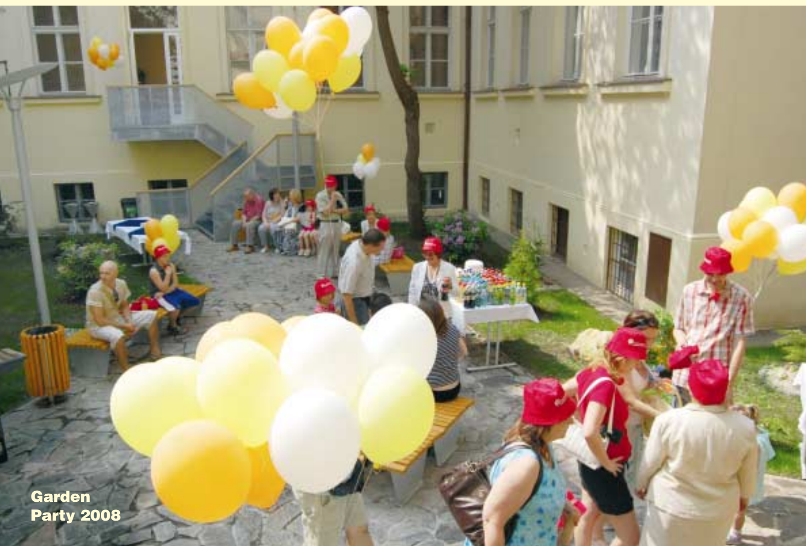
Garden Party 2008