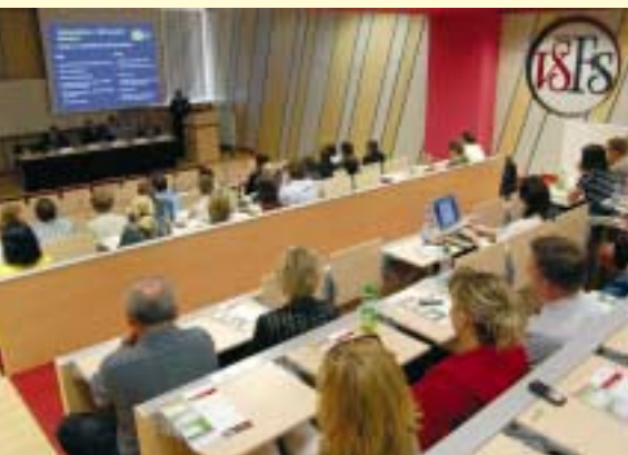
Panel Fúze a akvizice