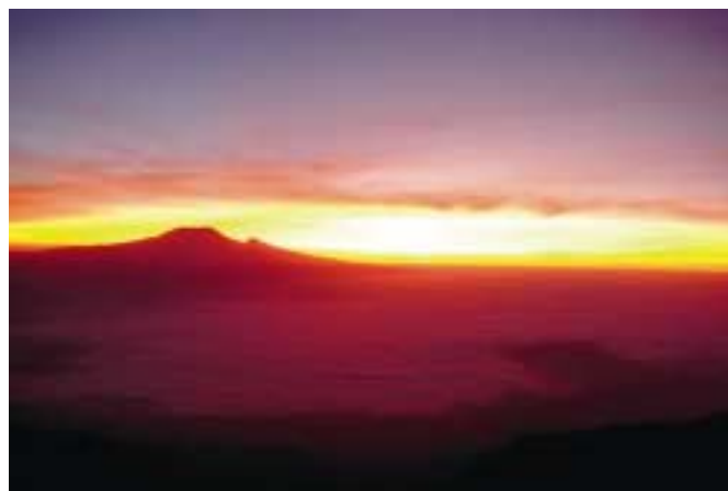
Východ slunce za Kili

Noci jsou v Africe krásné. Obloha je plná neznámých hvězd... Vycházíme hodinu po půlnoci téměř za měsíčního úplňku, vrháme dlouhé stíny a svítíme si čelovkami. V nočním chladu jdeme jako bludičky vřesovištěm, pak kamenitou stezkou prudce vzhůru, kameny postupně nahrazuje suť, šlapeme celou noc a za svítání vyběháme na hranu kráteru. Nechceme zmeškat východ slunce nad Kilimanžárem a úplně zapomínáme na „pole, pole“. Krása! Modročervená obloha a zlatý kotouč za siluetou Kili... Cítíme se dobře, takže zvolna pokračujeme v chůzi po hraně kráteru. Během krátké chvíle je světlo a okamžitě se otepluje. V osm hodin ráno jsme v cíli, stojíme ve výšce 4565 m nad mořem a pod vlajkou Tanzanie se šťastně fotografujeme na vrcholu páté nejvyšší hory Afriky.