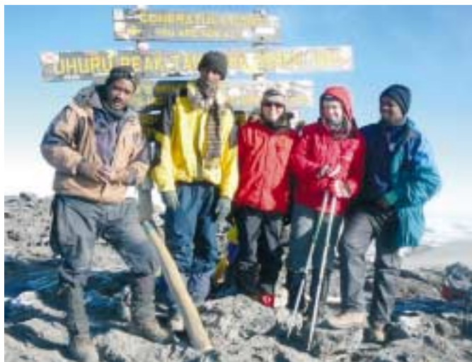
Na vrcholu Kilimandžára

Noc je dle očekávání chladná, ráno jiskřivé. Vycházíme po stezce mezi balvany lávového pole k lávovému monumentu Lava Tower ve výšce 4600 m. Jdeme husím pochodem spolu s dalšími turisty a předcházejí nás svižní nosiči. Od monumentu chodník prudce stoupá vzhůru sutí do Arrow Glacier Camp, my pokračujeme v cestě po vrstevnici a obcházíme masiv do tábora Barranco Camp ve výšce 3900 m. Cesta z Arrow Glacier Camp na vrchol je uzavřená z bezpečnostních důvodů. Traverzem sestupujeme z oblasti vysokohorské pouště opět do oblasti vřesů, kde se náhle mění počasí, zahaluje nás hustá mlha a padá drobný déšť. Všudypřítomný prach se mění v bláto. Po osmi hodinách přicházíme do stanového tábora mokří a prokřehlí. Ve stanech se převlékáme, zalézáme do spacích pytlů a ve vlhkém chladu se snažíme usnout.