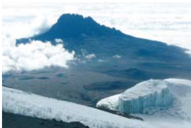
Ledovec na Kilimandžáru

Do stanového tábora dorazíme za šera po šesti hodinách „pole, pole“ pochodu. Večere ve společném stanu je jako z filmu Vzpomínky na Afriku. Sedíme na skládacích židlích a jíme z nádobí naservírovaném na černočervené kostkované masajské dece. Ledovec na vrcholu Kili se v měsíčním úplňku stříbrně leskne.