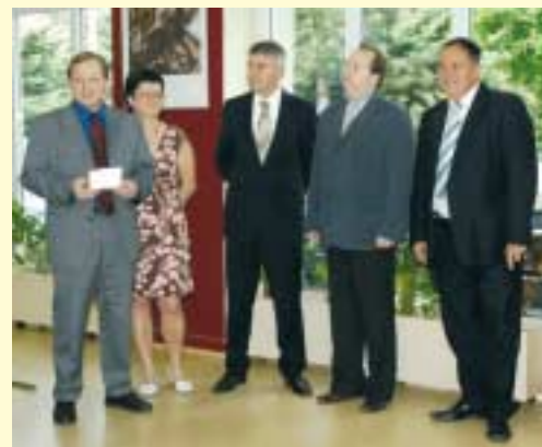
Návštěva slovinského velvyslance v Mostě