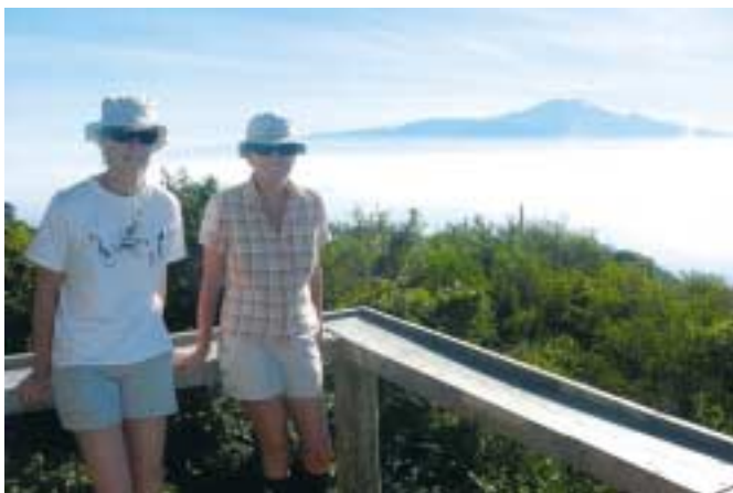
Ranní pohled na Kili z Mount Meru