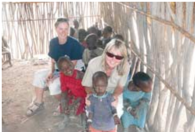
Škola v masajské vesnici v Tanzanii