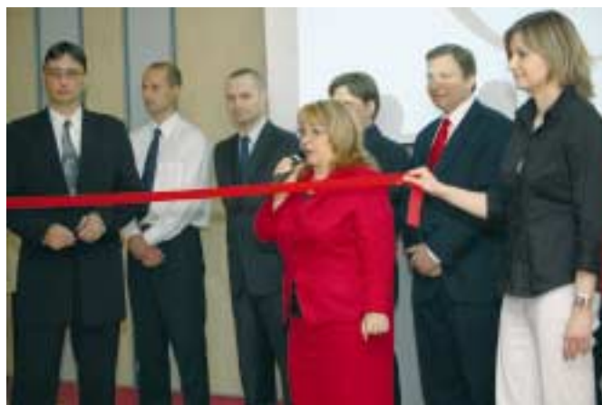
Jedním z hlavních bodů programu bylo slavnostní otevření kongresového centra

Nad tím jen mohu hořce zaplakat, že smrt mně vezme, co mám tolik rád.