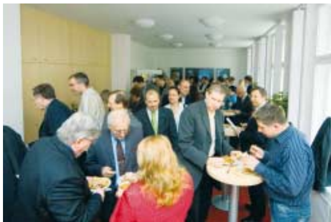
A pak už se jen jedlo, pilo ...