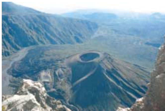
Vyhaslá sopka Ash Cone v kráteru Mount Meru

Konečně jsme po mnoha hodinách v táboře, rychle si balíme věci a pokračujeme v sestupu do Miriakamba Hut. Tam nás čeká večere, zasloužený odpočinek a nocleh.