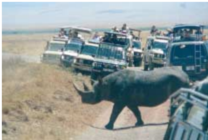
Černý nosorožec v národním parku Ngorongoro