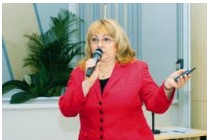
Rektorka ve své prezentaci představila významné novinky školy

Síly působící mezi nebem a zemí již našťastí až do konce programu nezasáhly, a tak se všichni přítomní na závěr stali premiérovým publikem nového školního filmu. Tvůrci filmové love story „Ledový čaj aneb Jak získat vzdělání a lásku“, která netradičně představuje školu, její prostředí, studijní programy, studenty i zaměstnance, netrpělivě čekali na odezvu jistě zkušeného a zmlsaného publika. Dočkali