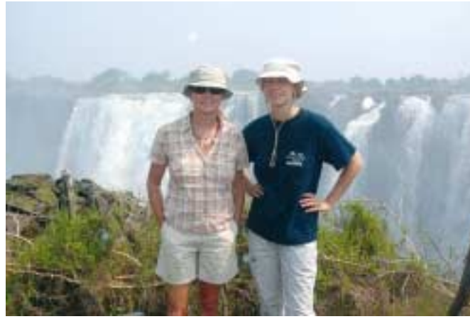
Viktoriiny vodopády v Zambii

V království srdcí byl bys pravý král, kdyby stín pomluv k tobě nezavál.