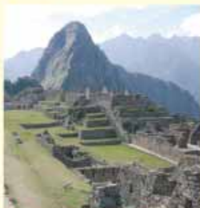
Machu Picchu v Peru