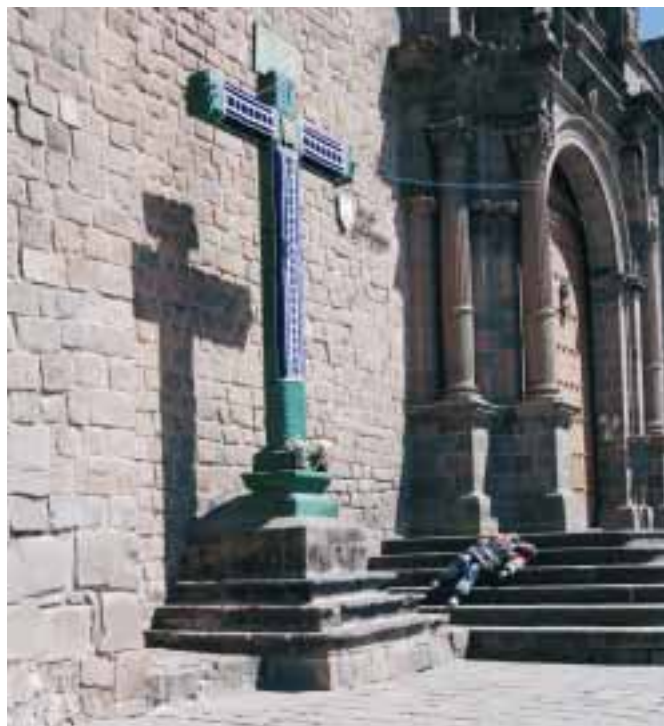
Živý „Kristus“ spadlý z kříže u katedrály San Francisco v Cuscu

Mělo to být tři a půl hodiny pohodového cestování vlakem po trati kopírující mezi velehorskými velikány světoznámou Camino Inka - Cestu Inků. Já to však neměla tak jednoduché. Zaplacenou jízdenku jsem nedostala včas a tak stíhám vlak, který mi ujel, pronajatým autem, které se řítí stovkou cestou necestou. Bůh suď, čím jsem urazila bohy dávných Inků, ale nejspíše z jejich vůle vlak, který jsem dohonila sto kilometrů před cílem, zkolaboval a nabral dvouhodinové zpoždění. Ještě před několika lety bych vystoupila a podobně jako mnozí jiní cestovatelé pokořila vrchol Machu Picchu pěšky. Na zdolávání vrcholů tímto způsobem už ale nemám věk. Konec konců, ty dvě hodiny byly nakonec příjemně stráveným časem s hledáčkem fotoáku u oka.