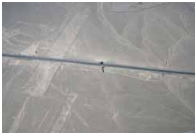
Geoglyfy v Nasce

tury zvířat a geometrických vyobrazení táhnoucích se do stakilometrových ploch mě ovšem ohromily přesto, že jsem nad nimi létala s žaludkem v krku a zkaleným zrakem.