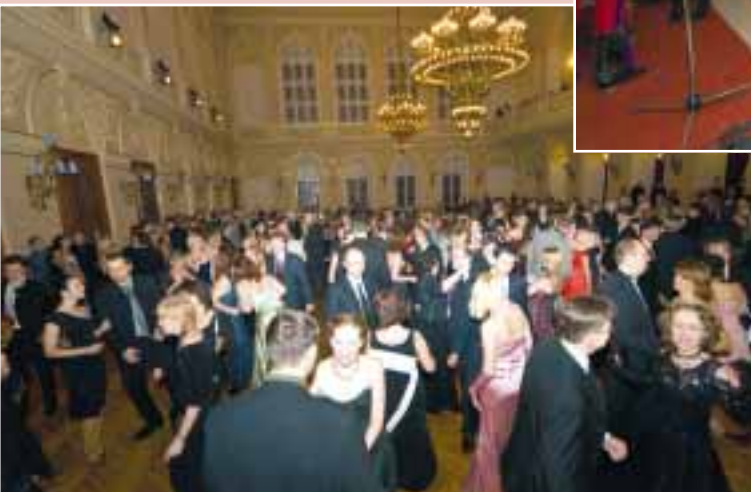
Pokud na pódiu neprobíhala některá část programu, byl taneční parket stále plný

Humor je nejdůstojnější projev smutku. Miloš Kopecký