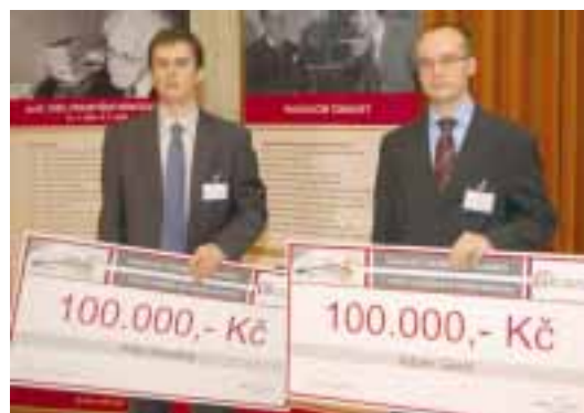
Vítězové soutěže o Cenu F. Vencovského

teže o Cenu prof. Vencovského je příslibem do dalších ročníků.