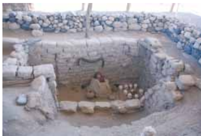
Pohřebiště v Nasce se zachovalými mumiami

Před odjezdem jsme navštívili pohřebiště s fantasticky zachovanými mumiami. Mým italským přátelům už při odjezdu nebylo dobře a v luxusním patrovém autobuse dostali horečku.