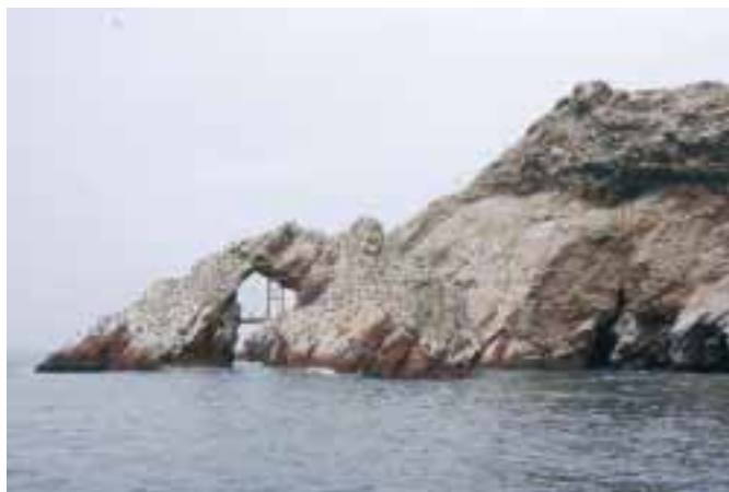
„Ptačí království“- ostrovy Ballestas

skály, o kterém se však, na rozdíl od obrazců v Nazca, ví, kdo ho vytvořil.