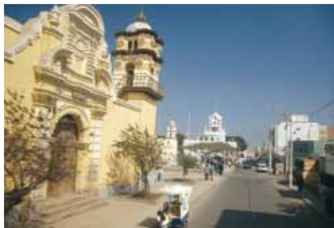
Kostel v Cusco po zničení zemětřesením

Před zemětřesením místo nepříliš známé, proslulé jsou spíše přírodní rezervace Paracas s ostrovy Ballestas v její blízkosti. Teď o něm ale vědí všichni, bohužel hlavně proto, že bylo zemětřesením ze tří čtvrtin zničeno. Od 15. srpna 2007 neexistuje už ani kostel proti hotelu, ve kterém jsem nocovala. V jeho troskách při zemětřesení zemřelo během dvou minut skoro 200 lidí. Já v nedaleké restauraci poprvé v životě srkám mate de coca. Čaj z koky dodává sílu a zlepšuje náladu. Co mě čeká dál?