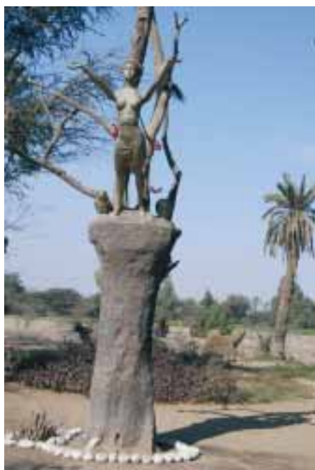
Hodná čarodějka v Ica