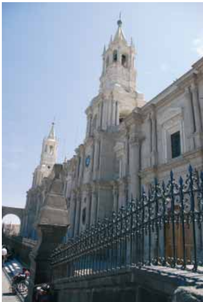
Katedrála v Arequipě postavená z vulkanické vyvřeliny

ným především svéráznou módou současných obyvatel. Většina z nich je indiánského původu, mnohé zbytky budov a linie ulic pamatují dobu Inků. Všude vlají peruánské červenobílé prapory, ale také duhové vlajky Inků. Šourám se městem a nasávám objektivem aparátu slovy nesdělitelnou atmosféru. U kostela San Francisco „spadl z kříže“ živý Kristus. Že by nějaké znamení? Dostavují se první příznaky horské nemoci – smrkám krev, k tomu úporná migréna... Preventivně zvyšuji dávku mate de coca. Ráno v pět mě čeká cesta na nádraží a pak hurá na Machu Picchu!