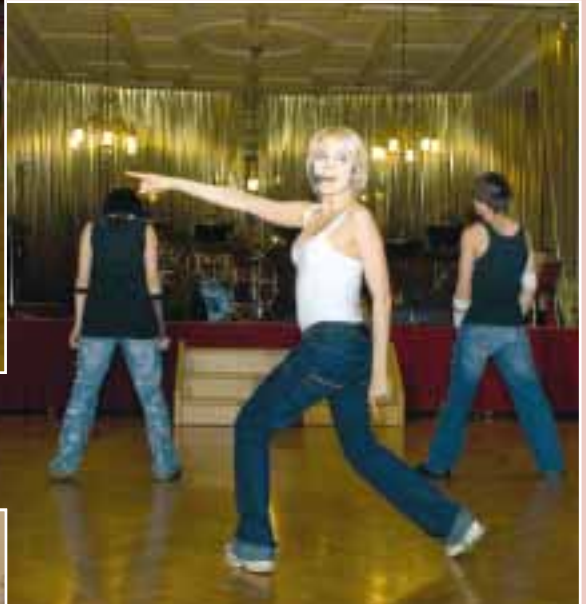
I vystoupení bronzové slavice Lucie Vondráčkové bylo plné tance