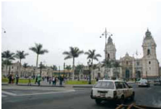
Plaza Mayor v Limě

Obrovská osmimilionová metropole je domovem pro bohaté, ale i útočištěm pro ty, kteří jsou chudí jako kostelní myši. Do metropole přicházejí lidé z celé země a doufají, že v ní naleznou štěstí. V průvodci jsem četla, že město