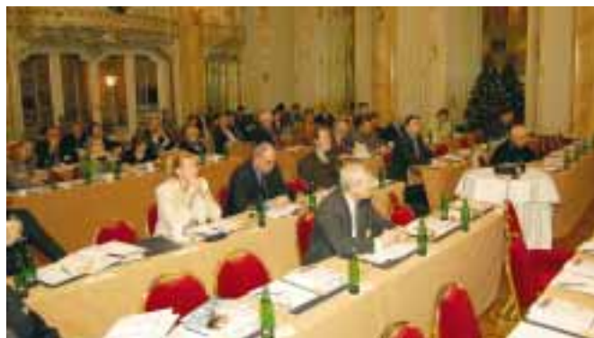
Pohled do publika

To, čím je mýdlo pro tělo, je smích pro duši. Židovské přísloví