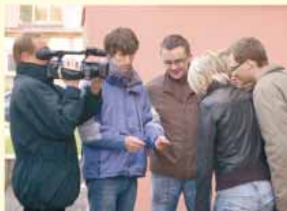
Natáčení filmu o škole