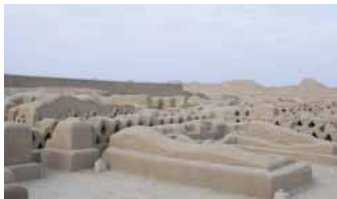
Ruiny města Chan Chan v údolí Moche