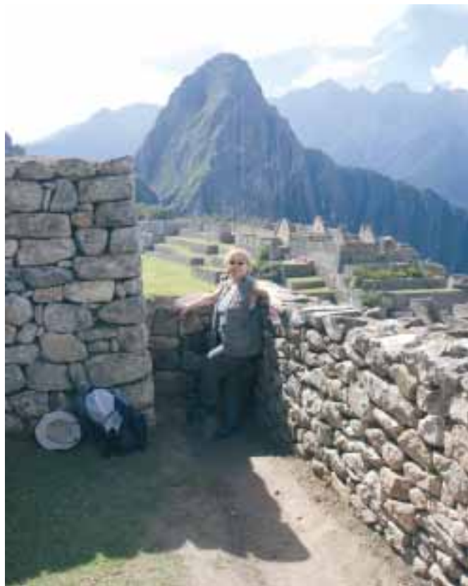
Autorka článku na Machu Picchu

Konečně jsem se dočkala a dorazila na Machu Picchu alias Starý Vrchol. Victoria! Navzdory všem překážkám jsem dosáhla vysněného cíle. Chráněn čtyřmi horskými štíty, uprostřed bujné vegetace, leží komplex chrámů, paláců