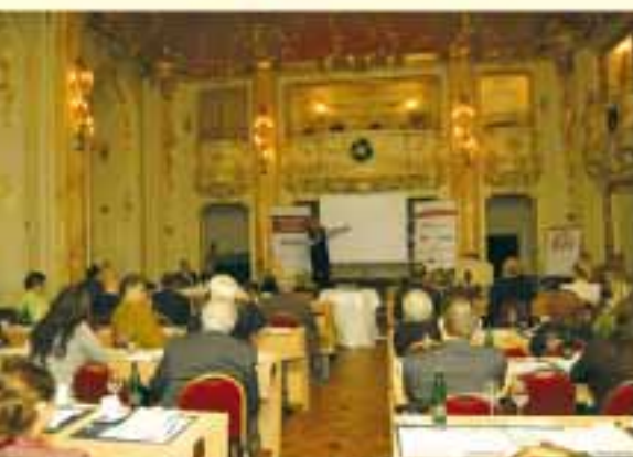
Konference Lidský kapitál