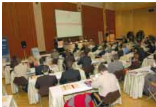
Kongresové centrum ČNB, místo konání konference