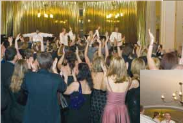
První hvězdou večera byla skupina ABBA STARS. Na náš ples zajela přímo z německého turné a dokázala posluchače doslova zvednout ze židlí