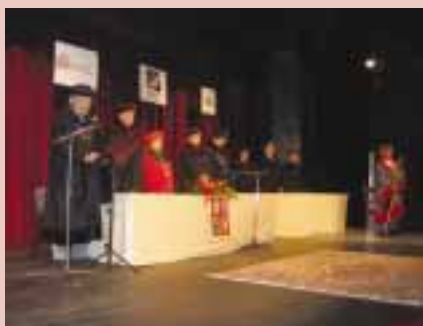
V Kladně se imatrikulace již tradičně odehrávají ve Středočeském divadle – 25. září 2006.

a krásných prostorách dodávajících jim slavnostní a důstojný ráz. Vraťme se tedy k okamžikům začátků i konců, které k životu školy neodmyslitelně patří.