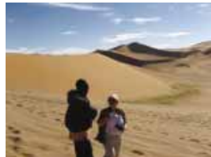
Nussy a já

dojedeme do Sesriem, kde se utáboříme. Cesta byla prašná, samá díra. Mijíme stromy s obrovitými ptačími hnízdy, kde žijí celé ptačí kolonie. Teplota našťástí výrazně stoupá, všude se vznáší prach a já konečně roztávám. Za chvíli máme v kolech už 1300 km. Mijíme úchvatné skály, jednou s „useknutými“ vršky, jindy vypadající jako hromada kamení, kterou někdo před chvílí vysypal z auta. Po nějaké době se objevuje první písek. Vítá nás poušť Namib. Je hrozné vedro, ale v noci prý bude zase zima. Ach jo, povzdechnu si, snad to nejhorší už mám za sebou. Po šesté hodině zapadlo slunce a byla zase zima. Dostala jsem