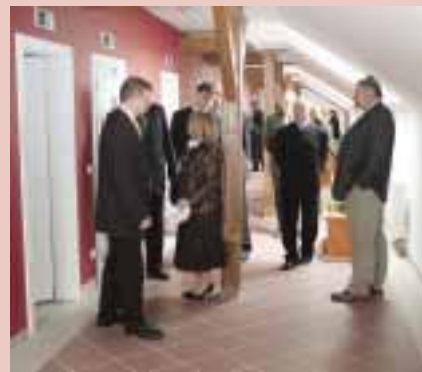
Prohlídka nových prostor

V Americe nezáleží na tom, kolik co stojí, ale kolik na tom ušetříte.