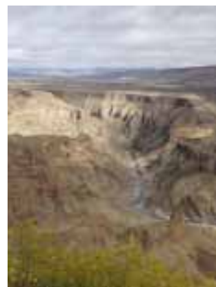
Fish River Canyon

desítek km před cílem lije jako z konve, třebaže je období sucha. Do toho prosvítají sluneční paprsky, takže výsledkem jsou duhy a také rozhodnutí, že dnes ve městečku Ai-Ais ve stanu spát nebudeme... Druhý den jsme vyrazili do Fish River Canyonu. Je to úžasná, naprosto ohromující podívaná. Je to druhý největší kaňon na světě a nachází se v místě, kde se prý dělily kontinenty. Jsou to vlastně