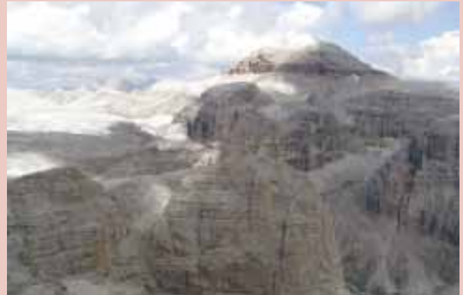
Dolomity v plné kráse