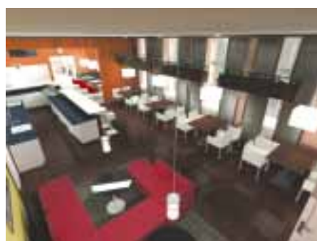
Kavárna a bistro

přes 350 návrhů od téměř 100 autorů, byl vybrán název TIM (time is money). Krátký rozhovor s autorkou názvu přinese v příštím vydání Šortek VŠFS. Takže nezapomeňte, už v prosinci se sejdem na kávu u TIMa!