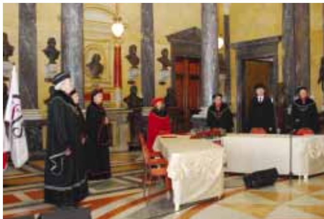
Slavnostní ceremoniál právě začíná za zvuků státní hymny.

hostů, jako ministryně školství, mládeže a tělovýchvy PhDr. Miroslava Kopicová a ministr financí Ing. Vlastimil Tlustý, CSc. Ceremoniál byl zpestřen netradičním vystoupením dívčího houslového tria Nobles, které přesvědčilo všechny zúčastněné o tom, že i vážná hudba může být podána nevázně a přitom s noblesou.