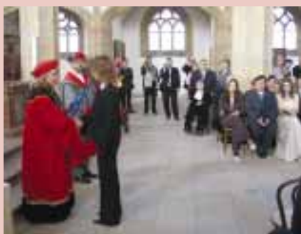
Promoce v kostele Nanebevzetí Panny Marie v Mostě dne 12. října 2006.