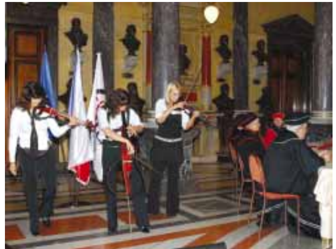
Skladby Růžový panter a Fate v podání dívčího houslového tria Nobles vzbudily v posluchačích opravdové nadšení.