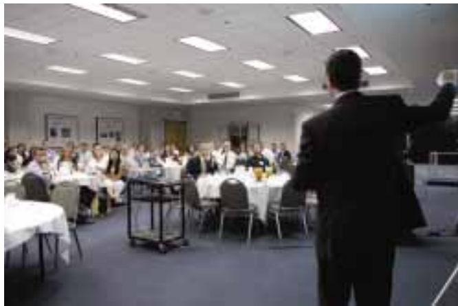
Přednáška „Distinguished Speakers“.

Poslední přednáška byla zařazena do tzv. série „Distinguished Speakers of Chapman university“. Tato přednáška byla určena pro bývalé absolventy MBA, profesory univerzity a pozvané významné hosty z regionu. Celkem přednášku navštívilo 100 posluchačů.