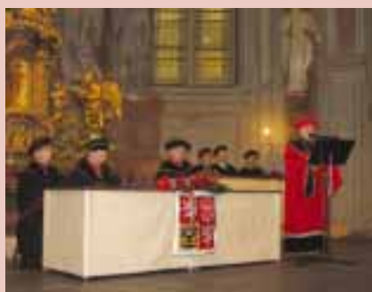
Promoce v kostele Šimona a Judy v Praze ve dnech 16. až 18. října 2006.