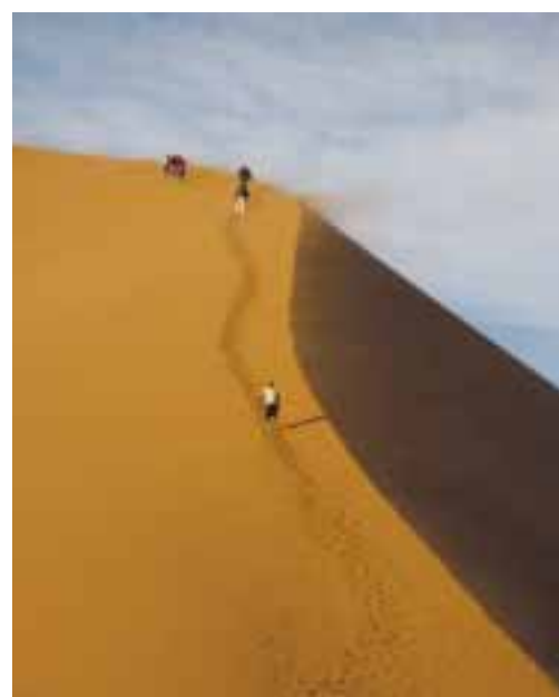
Duna v poušti Namib

do stanu plynovou lampu a trochu si to tam zahřála. Nic nenechám náhodě, „nabalím“ se hned. Spala jsem bez probuzení až do půl páté. Po tradiční snídani, která se obvykle skládá z několika krekrů, plátku sýra, banánu a kávy s mlékem, jsme vyjeli na duny. Přesedli jsme na místní dopravu s náhonem na všechna kola, protože náš VW tranzit by tolik písku nezvládl. Jako první jsme zdolali dunu Sossusvlei. Není to úplně snadné. Nohy se boří do písku, strmě stoupáme, fouká vítr a proto tolik necítíme žhnoucí slunce. Bez vody jsme ztraceni, sucho by se dalo krájet. Mám z toho rozpraskané rty. Vítr zvedá písek, musíme se smířit s tím, že ho máme absolutně všude. Zato pohled, který se nám z vrcholku naskytne, je něco, co se nedá slovy popsat, je to něco, co se musí vidět! Každého ohromí dálka. Kam jen oko dohlédne, se zvedají písečné duny. Ohromí nás i výška. Kdo to kdy viděl, aby příroda nakupila písek až do výšky 200 m! A co teprve tvary, ty jsou opravdu úchvatné. A když se k tomu přidá hra světél a stínů, zůstane každý zcela určitě, stejně