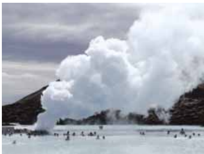
Termální lázně Modrá laguna

Škola se nachází zhruba 35 kilometrů od města Borgarnes v oblasti Borgarfjörður a 110 kilometrů od Reykjavíku. V okolí školy je vidět, že každým rokem se zde buduje a staví další nové zázemí pro studenty a zaměstnance školy. O tom, že tomu tak je, nás přesvědčil důkaz čilého stavebního ruchu za našeho pobytu, kdy se budovaly nové apartmány pro studenty a rozšiřovala se i kavárna s restaurací. Škola se neustále rozrůstá i počtem studentů a je velice pravděpodobné, že při tomto tempu bude Bifröst za chvíli vypadat jako samostatné město. V současné době žije v tomto univerzitním městečku na 600 studentů včetně zaměstnanců školy a do budoucna se počítá s 1000.