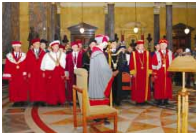
Účast zástupců z akademických řad byla skutečně hojná.