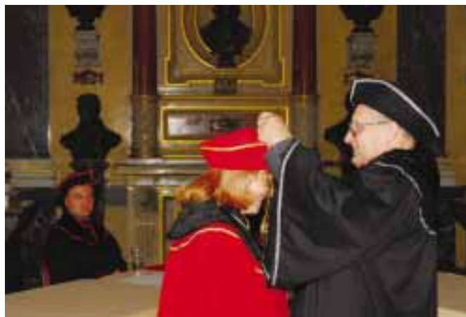
Součástí ceremoniálu je předání rektorského řetězu.

Velikost neschopnosti je přímo úměrná výši postavení.