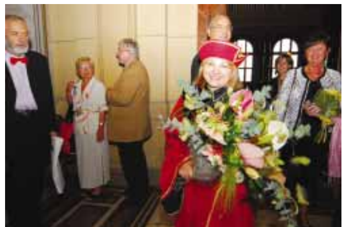
Nová rektorka přijala po skončení ceremoniálu nespočet gratulací.