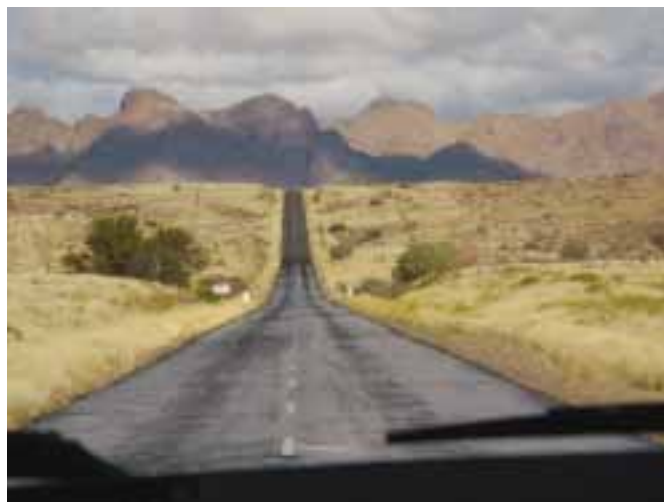
Cesta k Fish River Canyon