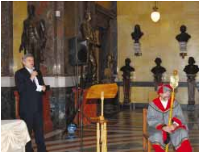
Člen akademické rady VŠFS, ministr financí Ing. Vlastimil Tlustý, CSc. zavzpomínal ve své zdravici na dlouhou cestu, kterou VŠFS ušla od svého založení.