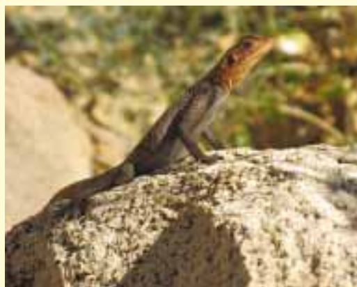
Údolí Aba Huab – ještěrka