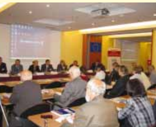
Konference Lidský kapitál