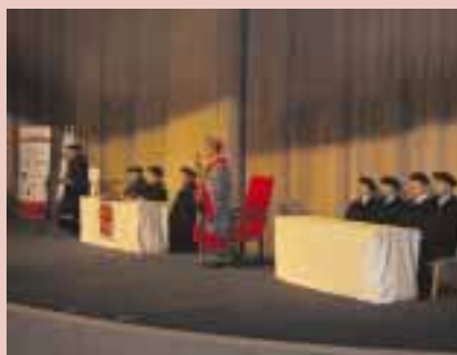
I v Mostě je hostitelem imatrikulací Městské divadlo – 2. října 2006.