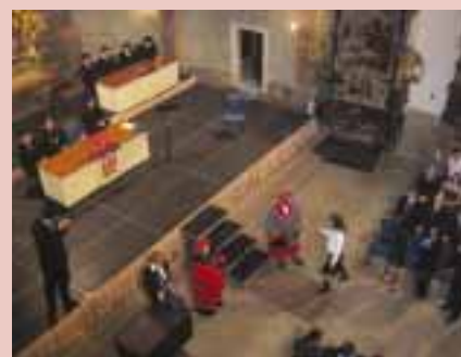
Netradiční pohled na absolventku skládající slib v kostele Šimona a Judy 16. října 2006.

I ta nejjednodušší myšlenka se dá vyjádřit složitě.