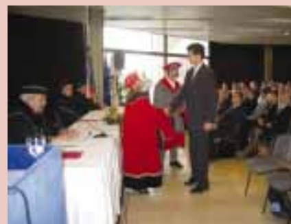
Potřetí proběhla imatrikulace pražských studentů v Kongresovém centru Praha – 30. září 2006.