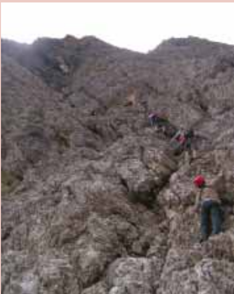
Začátek výstupu na Piz Sella