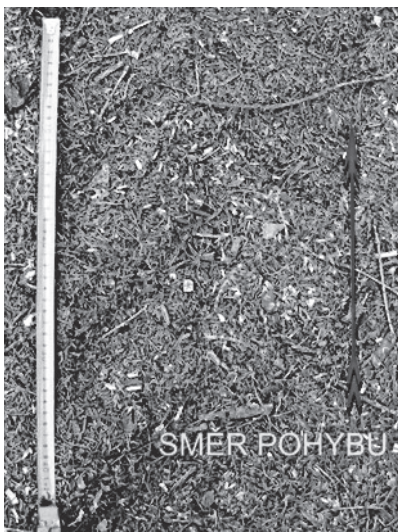
Obr. 1: Otisk pneumatiky s šípovým vzorem a vyznačení směru pohybu.