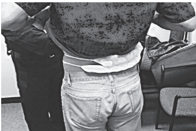
Obr. 4: Jedna z možností pašování vajec