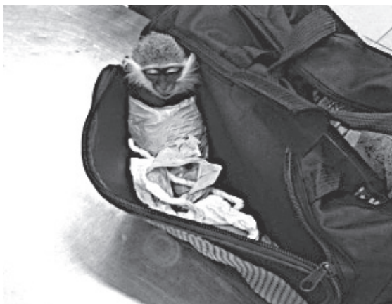
Obr. 3: Narkotizovaný kočkodan obalený izolepou

Snížení latence trestné činnosti, rychlé objasnění věci, potrestání pachatele, případně uložení přiměřeného peněžitého trestu by mohlo mít preventivní účinky. Je však zřejmé, že v této oblasti je prostor pro zlepšení, jak v práci policie a státních zastupitelství, tak soudů, neboť nízká kriminální citlivost k trestným činům proti životnímu prostředí se objevuje nejen u obyvatel, ale i u policistů, státních zástupců a soudců. To ostatně potvrzují i rozsudky ve výroku o trestu.