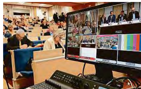
OKÉNKO DO FINANČNÍCH TRHŮ.

Oblast realit je velmi turbulentní. A tak pouze profesionálové ve svém oboru mohou být v dané branži úspěšní. Na základě naší zkušenosti s odbornými zkouškami pro realitní zprostředkovatele nabízíme klientům rozsáhlejší vzdělávací programy, a to Real Estate Specialist