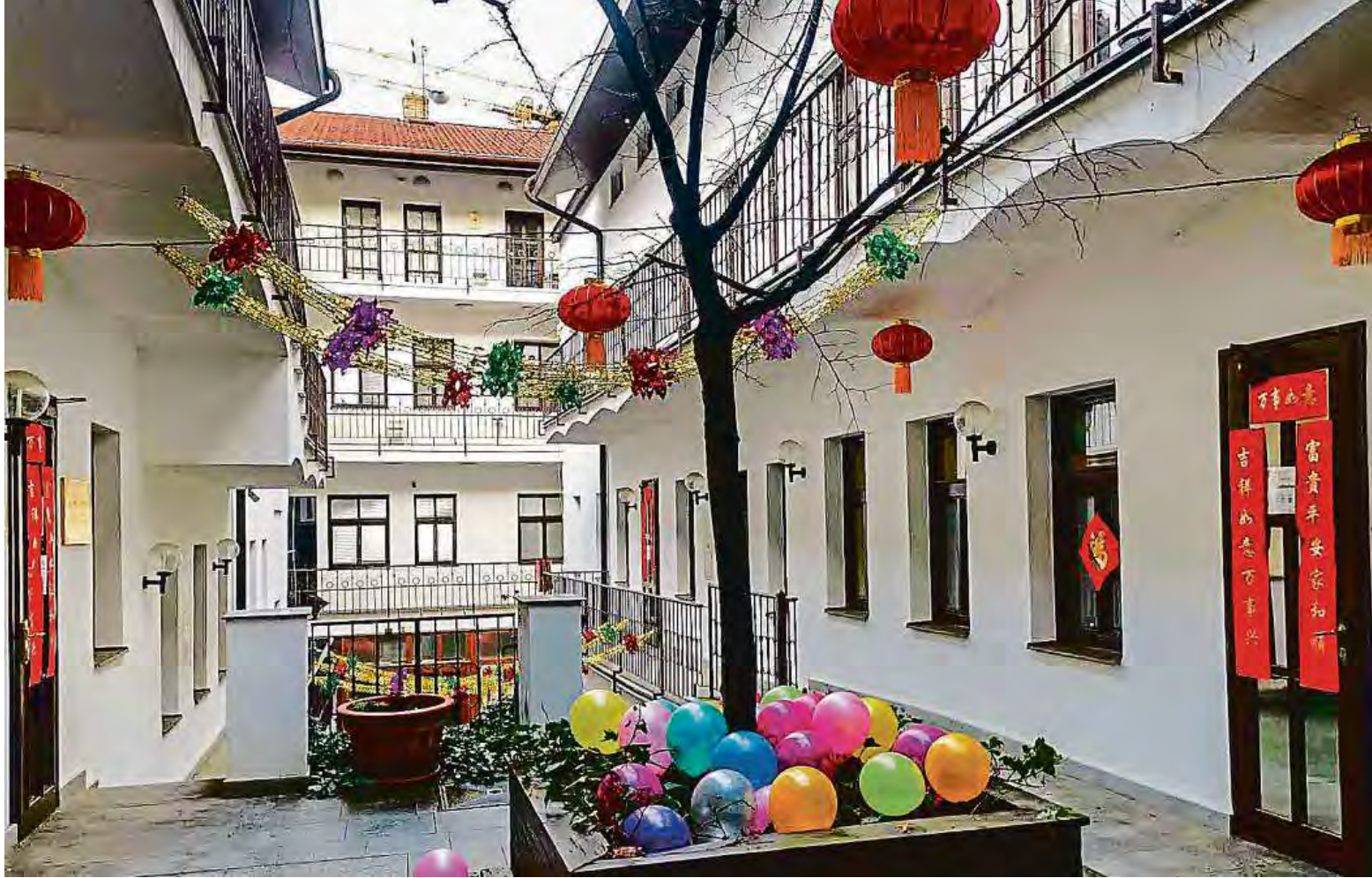
SLAVNOSTNĚ VYZDOBENÝ DVŮR KONFUCIOVA INSTITUTU V PRAZE NA ŽIŽKOVĚ.

Účastníky jsme pozvali na čínský čajový obřad, čínskou kaligrafii a tušovou malbu, ukázkovou lekcí čínštiny, ale třeba také na čínské karaoke, stolní hru majiang, focení v dobových kostýmech nebo vaření čínských svátečních knedlíčků. O akci byl skutečně velký zájem.