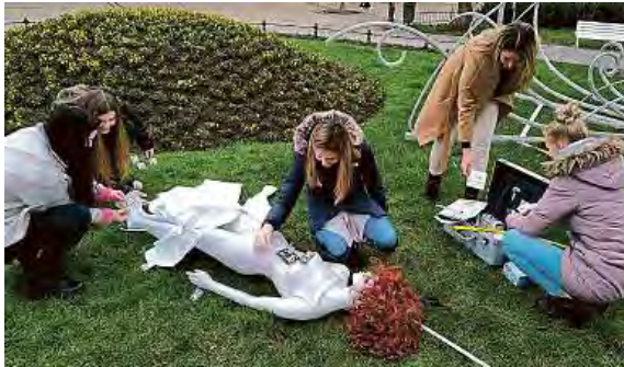
VÝUKA KRIMINALISTIKY VE STUDIJNÍCH STŘEDISCÍCH.

Za akademický rok 2021/2022 prošlo praxí 166 studentů. V jejím průběhu poznávali práci na důležitých odděleních policie,