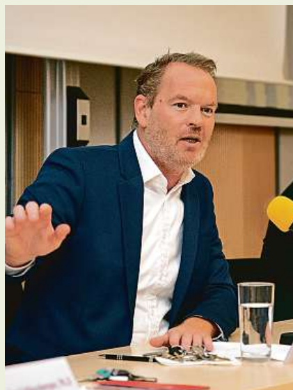
Autorem je doc. Mgr. Ondřej Roubal, PhD.,

Vzdělání je totiž tím, co zůstane, když zapomenete fakta. My tady ovšem s fakty pracujeme pravidelně a často si je i připomínáme. K těm klíčovým, které shromažďujeme a vyhodnocujeme, patří názory a postoje našich studentů k různým okolnostem jejich studijní dráhy. Na Vysoké škole finanční a správní pravidelně realizujeme sérii anonymních dotazníkových šetření s cílem identifikovat různé parametry studentského života. Zaměřujeme se nejčastěji na poznání úrovně jejich spokojenosti se studiem. Sledujeme jejich zpětnou vazbu na vnímání kvality konkrétních