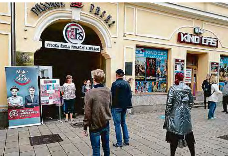
BUDOVA STŘEDISKA KARLOVY VARY.