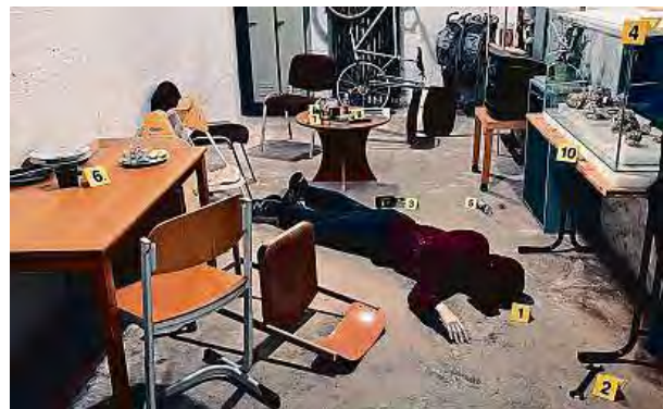
INSCENOVANÉ MÍSTO ČINU V JEDNĚ Z KRIMINALISTICKÝCH LABORATOŘÍ.

Studenti k tomuto praktickému cvičení přistupovali velmi zodpovědně a se zaujetím, což bylo znatelné po celou dobu jejich činnosti. Na samotný závěr oba pedagogové se studenty v rámci diskuse vyhodnotili průběh praktického cvičení a rovněž poukázali na nedostatky, kterých se studenti dopustili. Lze shrnout, že praktické cvičení